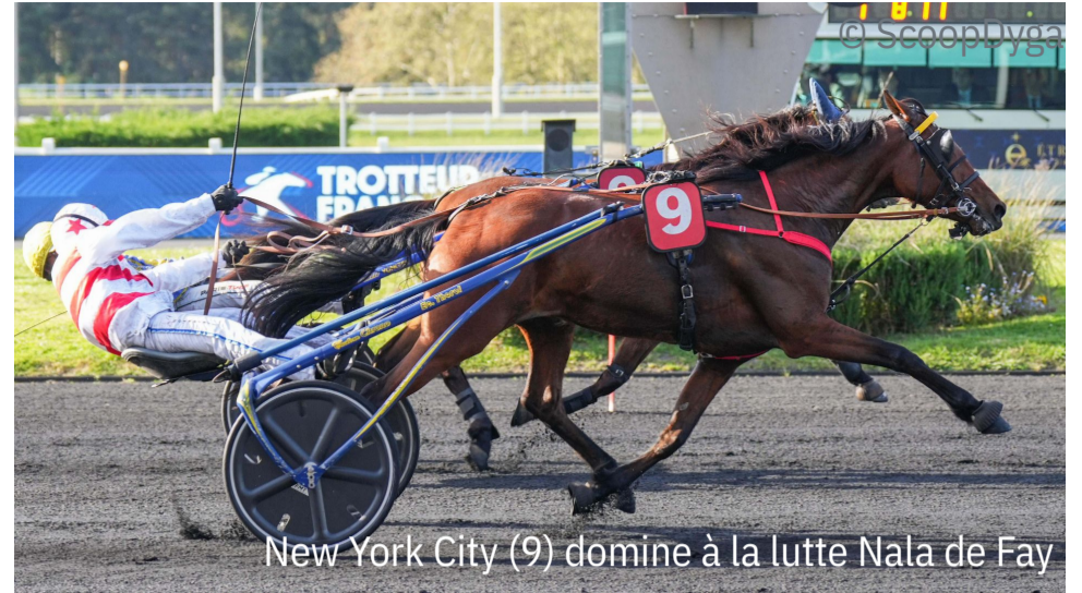
New York City (9) domine à la lutte Nala de Fay

4 e : Lucia Di Jenilat - 5 e : Kenidille - 6 e : Leonce du Clos - 7 e : Little Daidou