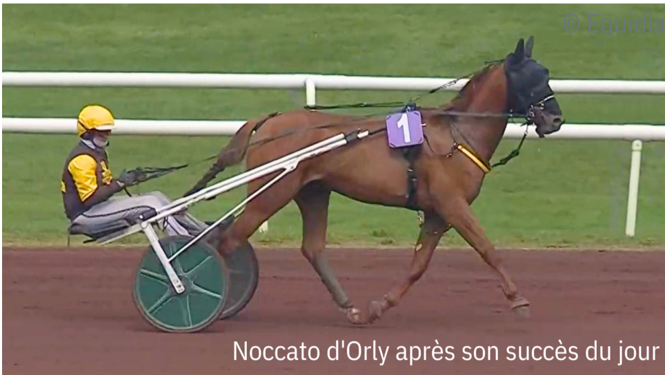
Noccato d'Orly après son succès du jour